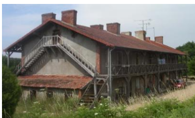
Caserne des Zagots

En cas de réhabilitation, il faut tenir compte de tous les matériaux qui composent la façade : brique, bois, pierre calcaire, zinc, ... qui ont déjà leur propre couleur.